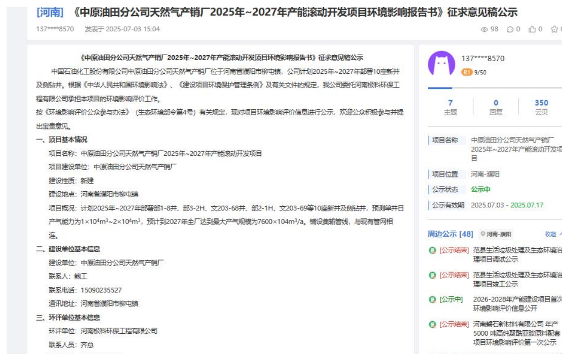
图2 征求意见公示截图