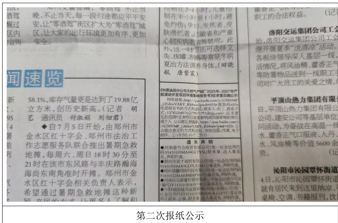
图 4 报纸公开情况