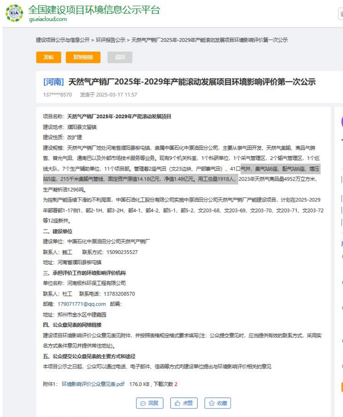
图 1 首次环境影响评价信息公开截图